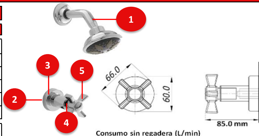
Consumo sin regadera (L/min)