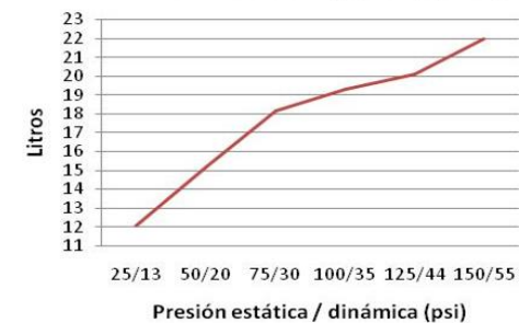
Consumo sin regadera (L/min)

Doméstico Ducha - No Tóxico. Cierre Cerámico Cuarto de Giro.