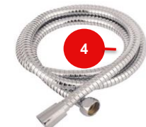
FICHA TECNICA DT FT 142