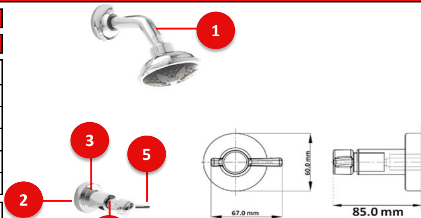
Consumo sin regadera (L/min)