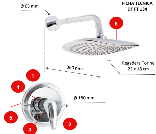
FICHA TECNICA DT FT 134