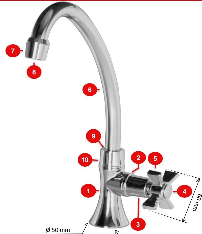
Consumo con Aireador Inteligente

Condiciones de uso: Doméstico Lavaplatos - No Tóxico. Cierre Cerámico Cuarto de Giro.