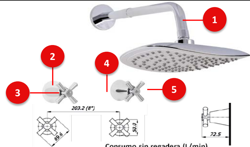
Consumo sin regadera (L/min)

Doméstico - No tóxico. Cierre Cerámico Cuarto de Giro.