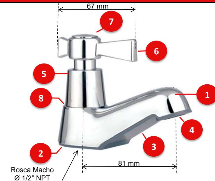
CONSUMO LLAVES INDIVIDUALES PLÁSTICAS