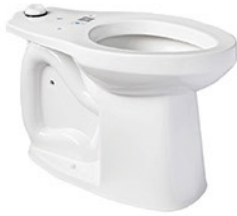
TAZA CS HANDICAP 4.8 LPF TRANI