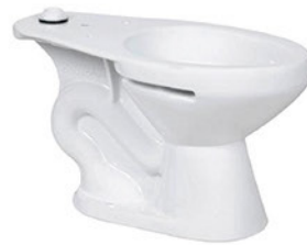
TAZA CS 4.8 LPF MONDELLO