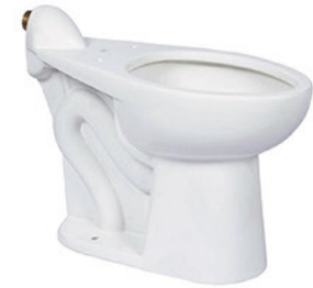
TAZA CP 4.8 LPF ZURN