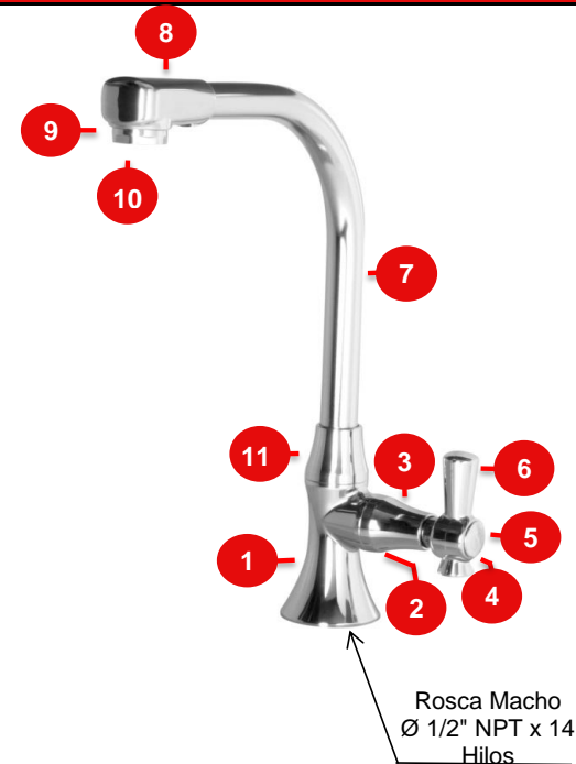
Consumo con Aireador Inteligente

Doméstico Lavaplatos - No Tóxico. Cierre Cerámico Cuarto de Giro.