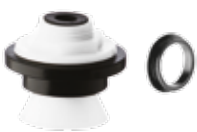
Spud de 3/4" para urinario y empaque